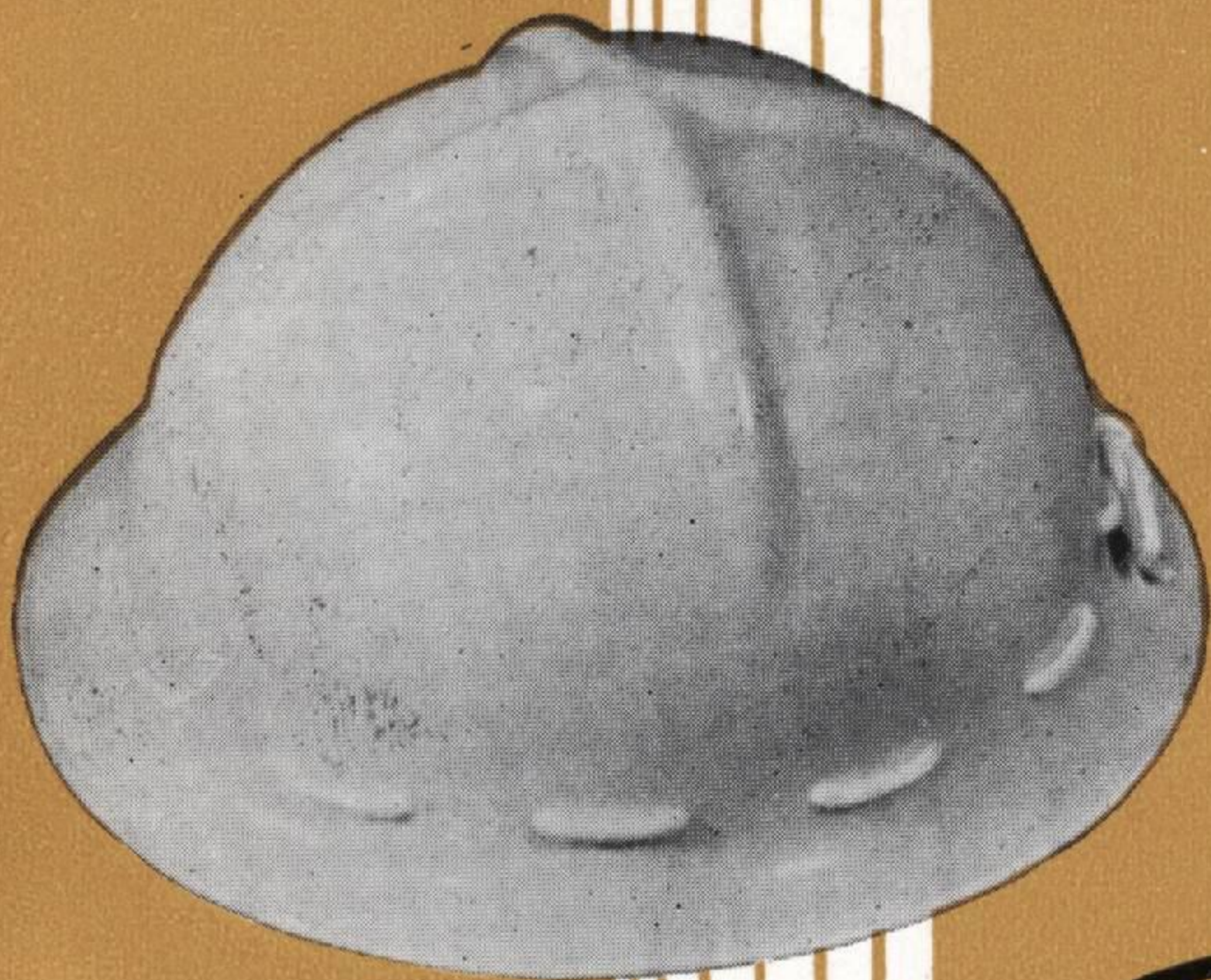
ST # 113 - B型 目方 350 グラム