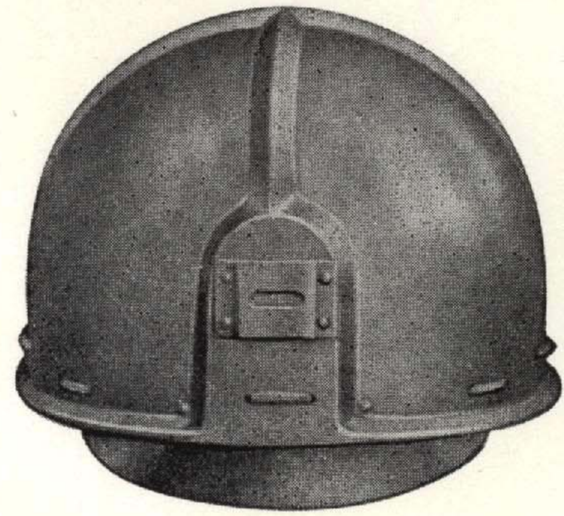
S. T. # 116 ランプ掛付型 目方 250 グラム