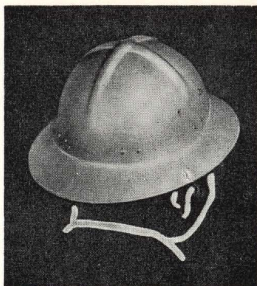
ランプホルダー付 S. T. # 118 目方 320 グラム