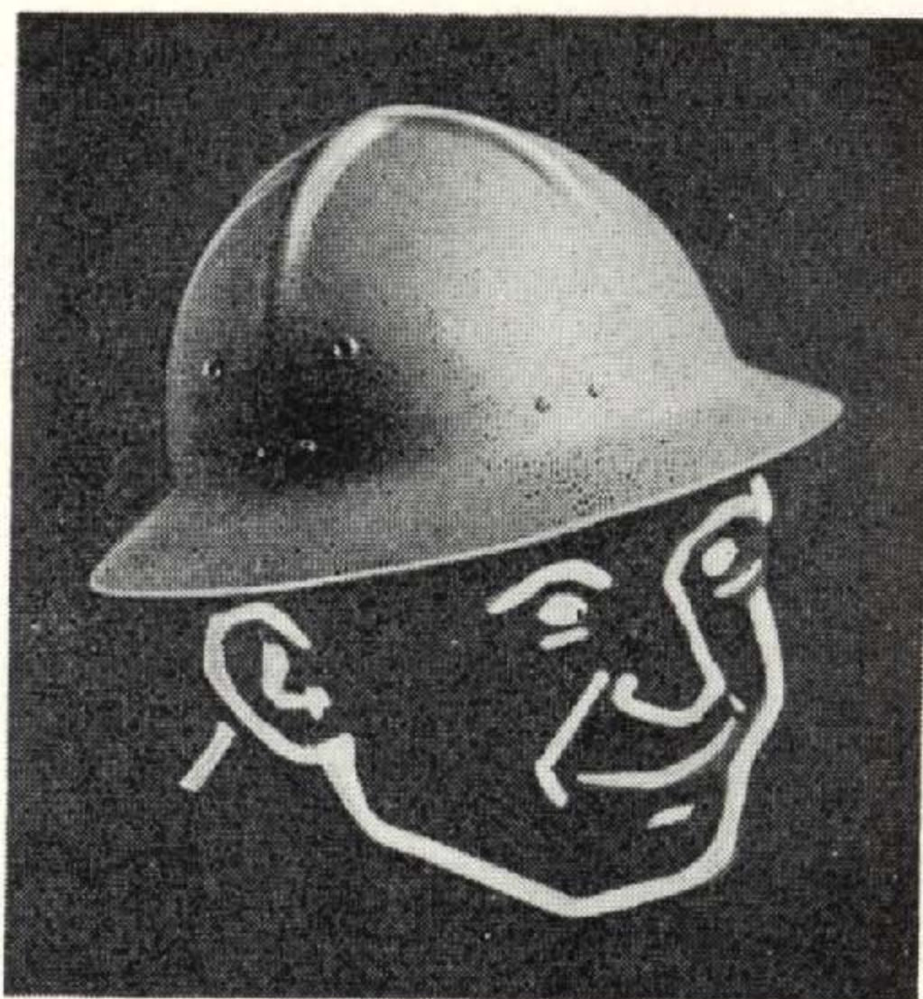
ヘルメット型 S. T. # 117 目方 300 グラム