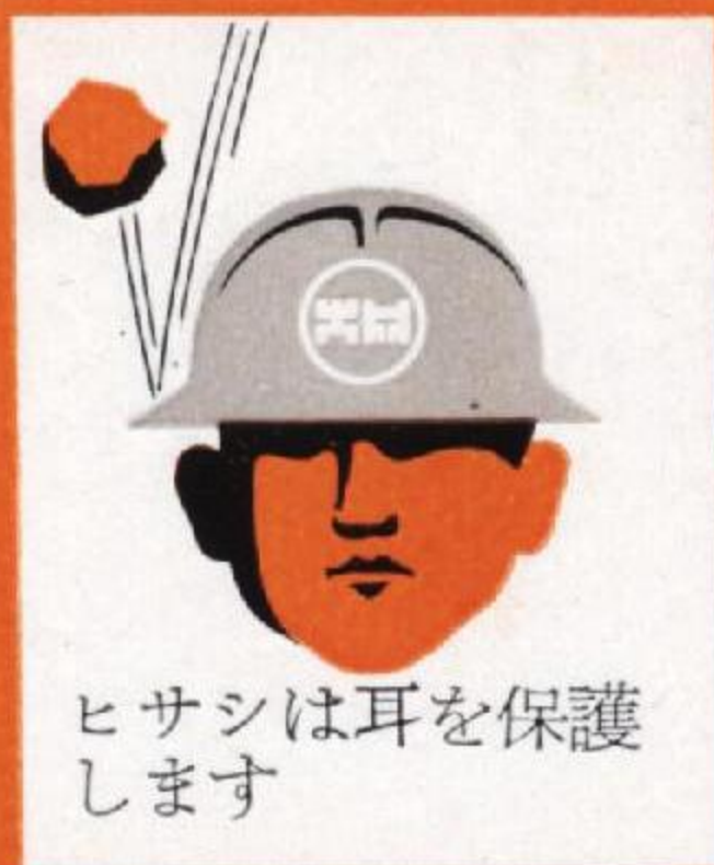
ヒサシは耳を保護 します