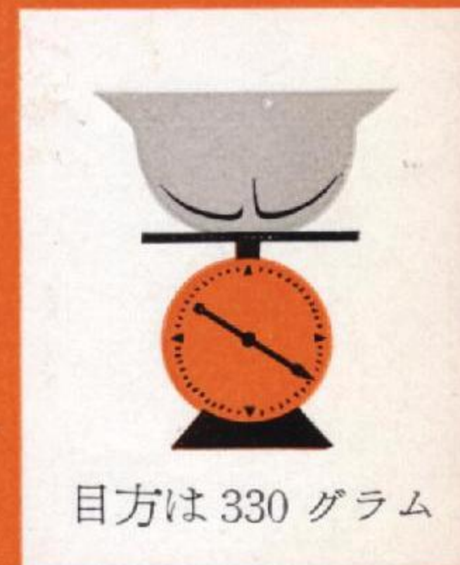
目方は 330 グラム