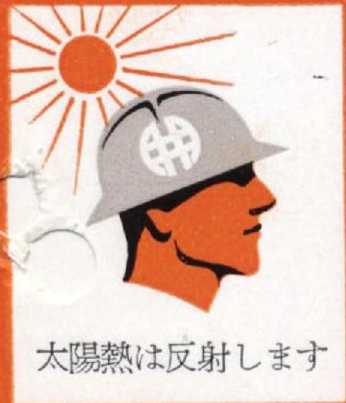
太陽熱は反射します