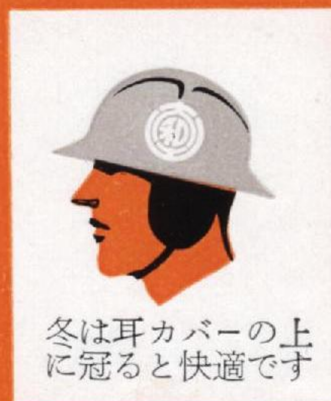
冬は耳カバーの上 に冠ると快適です