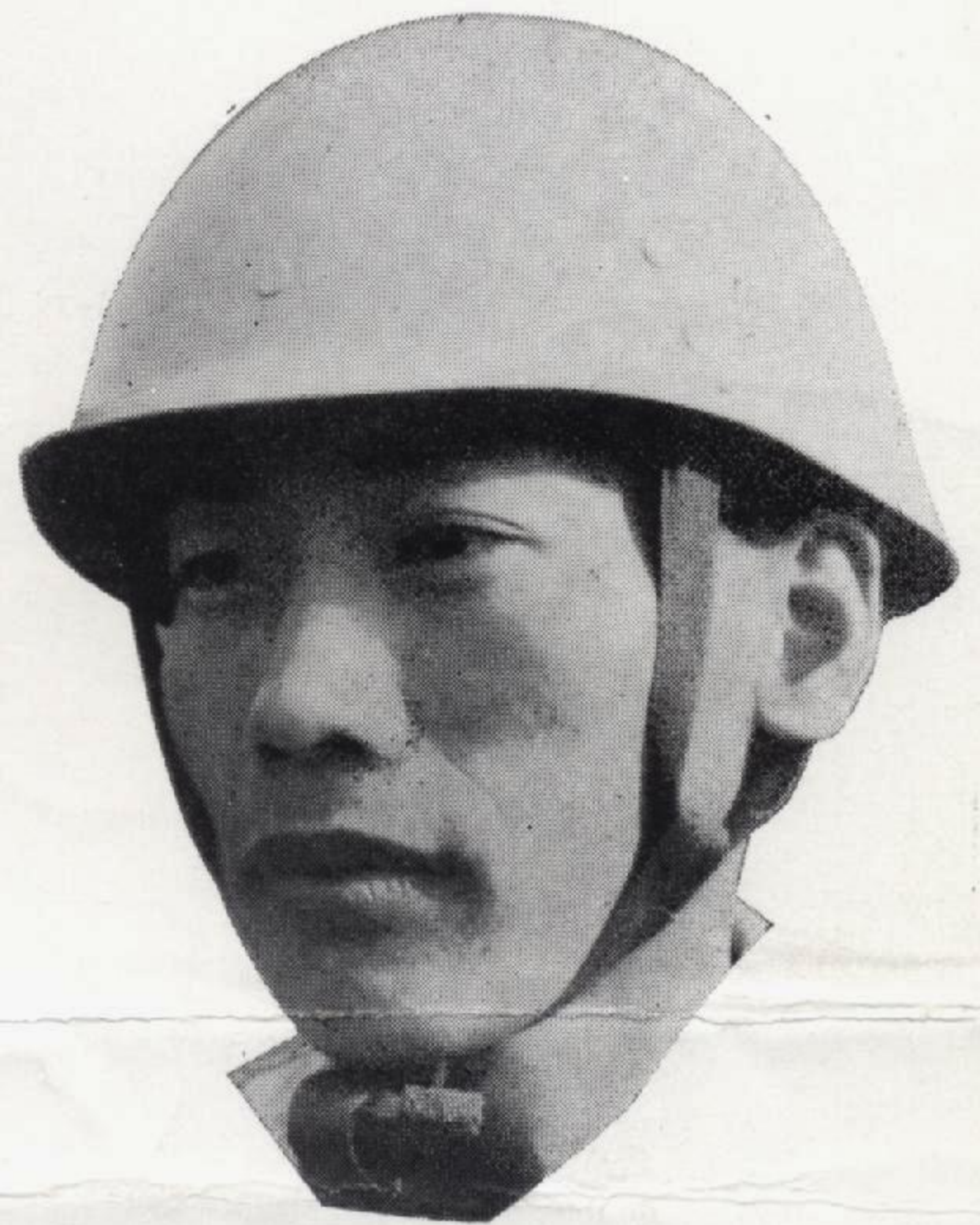
ST # 118-A MP型 保安帽 目方 350 グラム (内装、金具止め式)