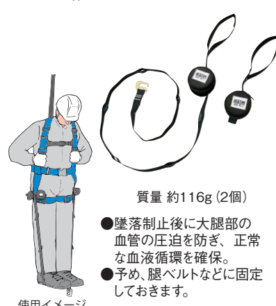
質量 約116g (2個)